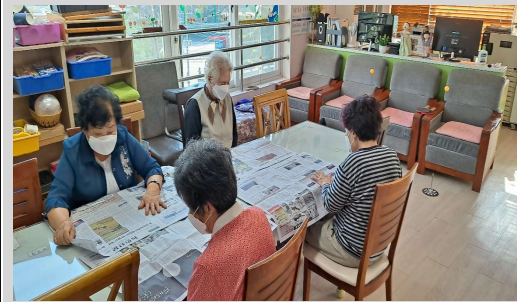
회상활동 // 세상뉴스전하기, 신문보기